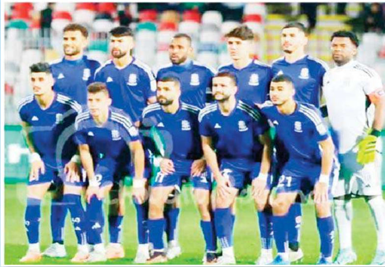
الموسم الكروي المقبل ، كسبها بواسطة الإطاحة بالجوار اتحاد مدينة بسكرة لثانية القائد

لا زال الجميع من طاقم فني ، الأنصار وكذا اللاعبين خصوصا بالنسبة للعناصر التي تألفت بشكل لافت في البطولة المنتهية دون تحقيق الأهداف المسطرة لها ينتظر بفارغ الصبر شروع الإدارة السوفية في ترتيباتها للموسم الكروي القادم لأجل الحسم في مستقبلهم إما مواصلة العمل مع النادي أو الرحيل وتغيير الوجهة نحو جهات أخرى ، لاسيما وأن الأيام تمر بسرعة البرق ولا يخدم تماما مصلحة هؤلاء بعد مباشرة أغلب الأندية في المستويين الرابطة المحترفة الأولى وكذا القسم الوطني الثاني اتصالاتها المبدئية قبل انطلاق عملية التعاقدات مع اللاعبين وإبرام العقود الرسمية التي تضمن تهينة السبل بالنسبة للنادي لأن يكون جاهزا مطلع الموسم الكروي المقبل .