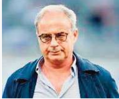
جالتبييه ثم لويس إنريكي الذي تولى المسؤولية في صيف العام الماضي 2023، بعقد لمدة عامين مع خيار التمديد لموسم ثالث.

تلقي لويس كامبوس المستشار الرياضي لنادي باريس سان جيرمان، عرضاً سعودياً مغرباً، خلال الأيام القليلة الماضية. وكشفت صحيفة "ليكيب" أن هناك خطوة من المستثمرين السعوديين لشراء نادي موناكو الفرنسي، والتعاقد مع لويس كامبوس. وأضافت أن المستشار الرياضي لليي إس جي، بإمكانه أن يكون الرئيس القادم لنادي موناكو. ويعمل لويس كامبوس مستشاراً رياضياً للنادي الباريسي منذ صيف 2022، حيث تولى المسؤولية خلفاً للبرازيلي ليوناردو. وأنهى فريق موناكو، مشاركته في الدوري الفرنسي خلال الموسم الماضي، في الوصافة، ليضمن التأهل مباشرة للدوري أبطال أوروبا. أما كامبوس فقد بدأ مشواره مع باريس مع المدرب كريستوف