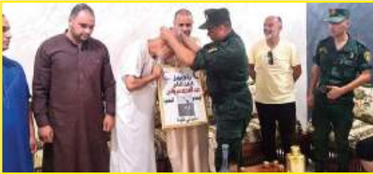
البقاع المقدسة ترحموا بها على روح ابنهم الطاهرة شهر ماي الماضي.