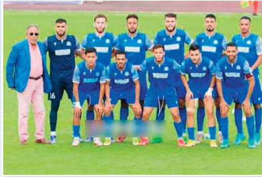
التحقوا متأخرين بالفريق قبل بداية الموسم.

سيكون العمل الكبير كله مُنصبا نحو خط الهجوم الذي ضيع الكثير من الأهداف بسبب التسرع وعدم التركيز مما يحتم على المدرب حجار إعطاء أهمية كبيرة له خلال التدريبات بوضع حصص خاصة أمام المرمرى مع رسم خطط تساعد المهاجمين على تسجيل الأهداف، وهذا بإسنادهم تعليمات حول كيفية