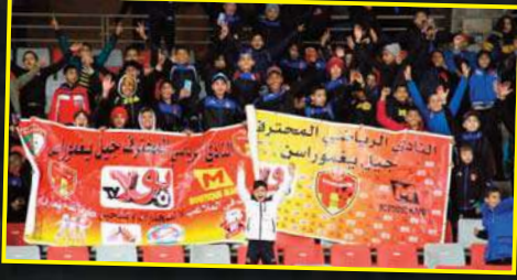
رفعوا لافتة لافتة تحمل شعار بولا

لاعبو جيل يغموراسن حاضرون في ملجعات هدا في