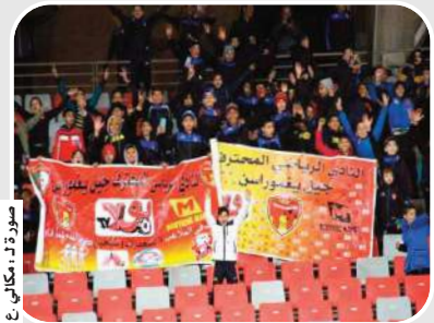
صورة لـ مكالي ن

حضر لاعبو نادي جيل يغموراسن لكرة القدم مباراة المنتخب الموريتاني ونظيره المالي أول أمس في ملعب ميلود هدي، وصنع البراعم أجواء كبيرة في المدرجات وكلهم أمل في الوصول يوما ما لحمل قميص المنتخب الوطني واللعب في أجواء ملعب ميلود هدي، كما حمل لاعبو جيل يغموراسن لافتة النادي في المدرجات والتي تحمل شعار جريدة بولا.