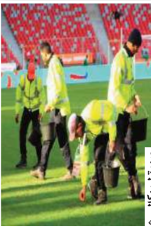
صورة لـ مكالي ن

قام عمال صيانة أرضية ميدان ميلود هدي بعمل جبار من أجل أن تكون في أفضل حلة وتسمح للاعبين بتقديم أفضل أداء ممكن، حيث أن الأرضية لم تتأثر رغم الأمطار الغزيرة ورغم إجراء مباريات في اليوم على ذات الأرضية، إلا أن العمال لم يتوقفوا عن الصيانة من أجل عدم ترك أي أمر للصدفة وتقديم أفضل صورة ممكنة عن الملعب وأرضية الميدان وعن تنظيم الجزائر لهذه النسخة من الشان.