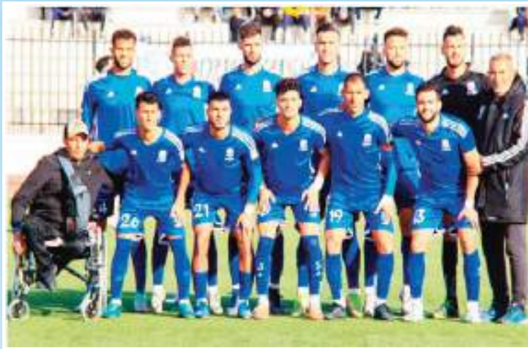
صحيح أن النادي السوفي دخل اللقاء بكل قوة وقدم مردود جيد في المرحلة الأولى من المباراة التي كان قد أنهاها لفائذته ومقديما بهدف مقابل صفر ، إلا أن الأمور انعكست رأسا على عقب خلال النصف الثاني من اللقاء الذي كان أغلب فتراته للنادي المنافس ، خصوصا من

أثرت النتيجة السلبية المسجلة أمام المولودية الوهرانية على وضعية النادي السوفي في سلم الترتيب العام للبطولة بعد سقوط الورقة الثالثة من العودة ، خصوصا على مستوى مؤخرة الترتيب المعني بها الأخير ، بعد فوز أقرب المنافسين على تقادي كارثة السقوط للقسم الوطني الثاني ، ويتعلق الأمر بنادي نجم بن عكنون الذي أطاح على أرضه بضيفه شبيبة الساورة ، وكذا استفادة أبناء مدينة الباهية وهران بكامل الزاد للجولة الأخيرة ، مما جعل الفارق يتصدد من جديد بعدما تقلص في الخطة الأخيرة عقب فوز النادي السوفي على بسكرة وتسجيل الناديين لنتائج عكسية .