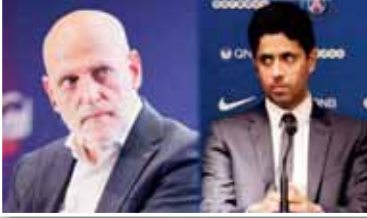
أطلق خافيير تيباس، رئيس رابطة الدوري الإسباني، تصريحات قوية خلال تواجده في فرنسا، مستغلاً الفرصة لتوجيه