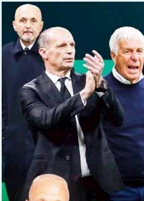
الموسم، قبل أن ينهار في اللحظة الحاسمة.

لكن القصة الأجل والأكثر إلهاً في الدوري الإيطالي هذا الموسم كانت من نصيب نادي كومانو، الذي حقق إنجازاً تاريخياً وغير مسبوق بتأهله إلى دوري أبطال أوروبا لأول مرة، بعد فوزه الكبير على كرميونسي بنتيجة 4-1. وقدم كومانو مباراة مذهلة أكد خلالها شخصيته القوية والطموحة، حيث افتتح جيسوس رودريجز