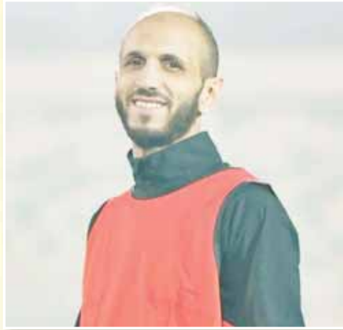
اللاعب ليس بيده، وإنما بيد فريق شبيبة القبائل الذي لا يزال مرتبطا معه بعقد تمتد لموسم إضافي.

رفع فريق شباب بلوزداد، رصيده إلى النقطة 51 في المركز الثالث في سلم الترتيب العام للرابطة المحترفة الأولى، بفارق نقطة عن صاحب المركز الثاني شبيبة الساورة، وهذا بعد فوزه بنقاط لقاته المتأخر الذي جمعه بنجم بن عكنون أول أمس في الجزائر العاصمة، وهو ما يشعل المنافسة أكثر بينه وبين شبيبة الساورة على المركز الثاني، حيث أثنى عمراي مطالبين بالفوز بنقاط المباراة الأخيرة من البطولة التي ستجمعهم بشباب قسنطينة في 6 جوان الداخل في ملعب 20 أوت بشار، وانتظار تعادل أو هزيمة شباب بلوزداد في اللقائين المتبقين له في البطولة أمام اتحاد العاصمة وشبيبة القبائل، لإنهاء البطولة في المركز الثاني، أما في حالة فوز أبناء العقبة باللقائين، فإن « النسور» سينهون البطولة في المركز الثالث.