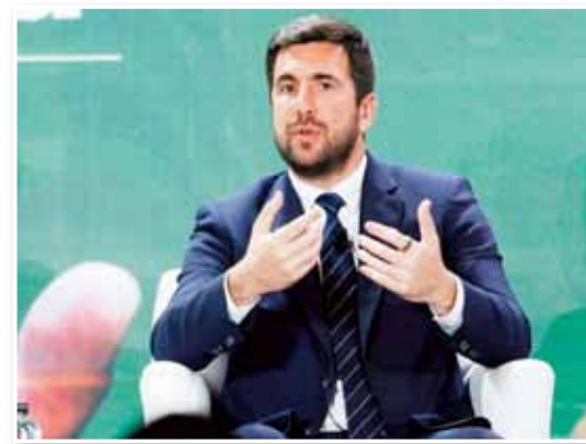
أكد إنريكي ريكلمي، المرشح لرئاسة نادي ريال مدريد، على ضرورة "استعادة قيم ريال مدريد السابقة"، وذلك بعدما تقدم رسمياً لخوض السباق أمام فلورنتينو بيريز. وفي مقطع تاريخي لم يشهده

النادي الملكي منذ عقدين، أقرت اللجنة الانتخابية لريال مدريد رسمياً، ترشيح رجل الأعمال إنريكي ريكلمي، 37 عاماً، لمنافسة فلورنتينو بيريز، 79 عاماً، على رئاسة النادي، في أول انتخابات حقيقية منذ عام 2006 عندما فاز رامون كالديرون بالمنصب عقب استقالة بيريز المفاجئة خلال ولايته الأولى. وفي تصريحات لصحيفة "ماركا"، شدّد ريكلمي، على ضرورة أن يعيد النادي اكتشاف هيكل إداري أقرب إلى أعضائه، وغوّض يعتقد أنه قد أضعف حالياً بسبب تجاوزات التخصصات والاندماج الشفافية. على الصعيد الرياضي، ناقش ريكلمي طموحاته لتعزيز صفوف ريال مدريد في حال توليه الرئاسة. وصرح قائلاً: "سنضم لاعبين كباراً، أفضل اللاعبين الذين يحتاجهم ريال مدريد سينضمون إلينا". يعكس هذا التصريح رغبة المرشح في إحداث تأثير كبير في سوق الانتقالات، بالتزامن مع إطلاق مشروع ضخم لرفع مستوى احترافية الهيكل الرياضي للنادي.