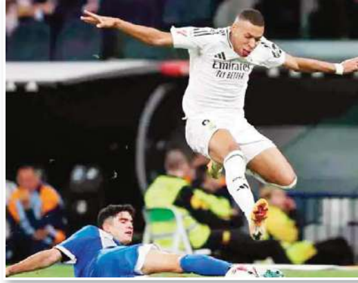
رفع ريال مدريد رصيده إلى 17 نقطة في وصافة الليغا، يفارق نقطة وحيدة عن المتصدر برشلونة الذي لعب مباراة أقل، بينما تجمد رصيد ألافيس عند 10 نقاط في المركز الثامن.

أثار الفرنسي كيليان مبابي نجم ريال مدريد، حالة من القلق، عقب الانتصار الصعب (2-3) على ديورتيغو ألافيس، ضمن الجولة السابعة من الليغا، في معقل المرنجي "سانتياجو برنابيو". وتم استدعاء الفرنسي في الدقيقة 80، واتضح بعدها أنه يعاني من آلام في الفخذ الأيسر، وفقاً لصحيفة "موندو ديورتيغو" الإسبانية. وعن حالة مبابي، علق كارلو أنشيلوتي المدير الفني لريال مدريد، عقب المباراة: "العضلة كانت مشدودة بعض الشيء"، لكنه لم يذكر، كما أفادت وسائل الإعلام لاحقاً، أنه سيتم إجراء فحوصات للاعب الخميس، لمعرفة مدى خطورة الإصابة. يأتي ذلك مع اقتراب ديربي مدريد في الليغا، المقرر الأحد المقبل، ما يثير الشكوك حول جاهزية اللاعب للمباراة الأهم حتى الآن في الموسم. وسجل لريال مدريد لوكاس فاسكيز، كيليان مبابي، ورودريغو في الدقائق 1، 40، و 48، بينما أحرز لديورتيغو ألافيس كارلوس بينافيدز وكيسي جارسيا في الدقيقتين 85 و 86. وبهذا الانتصار