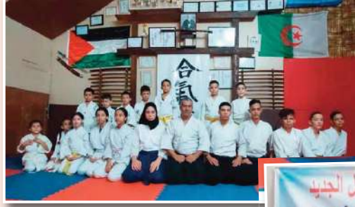
تغطية: داد هاشم

الرياضي الهاوي الجيل الجديد الذي يواصل التساق والبروز من خلال إعطاء الأولوية للتكوين. وكان ميلاد رياضة الأيكيدو في الجزائر سنة 1983 تحت وصاية الاتحادية الجزائرية للجيود، وفي سنة 2000 انضمت إلى الاتحادية الجزائرية للفنون القتالية ونشطت كلجنة وطنية في هذا الاختصاص حتى سنة 2017 حين تأسست كاتحادية مستقلة بذاتها. للإشارة، تحمي الهيئة الفيدرالية 20 ألف ممارس لرياضة الأيكيدو، يمثلون 14 رابطة ولائية (متواجدين عبر 43 ولاية)، كما أن عدد المدربين ارتفع إلى 700 مدرب ونسبة 70 بالمائة من مزاولي هذه الرياضة تنتمي لفئة الأطفال.