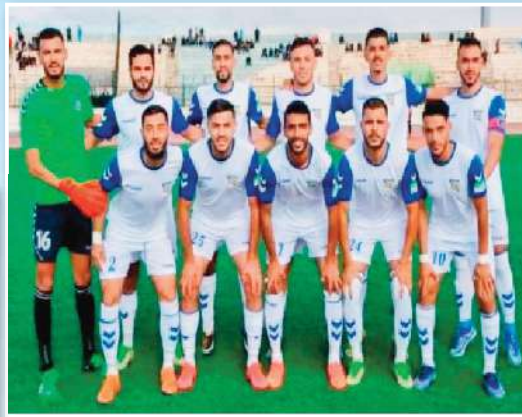
الهيمنة أمام بوفاريك كانت درسا للاعبين

أن أعضاء الطاقم الفني قاموا بعمل نفسي كبير للرفع من معنويات اللاعبين ومطابقتهم بضرورة نسيان تلك المواجهة. ويبقى الأهم هو أن تواصل الشبيبة العمل بنفس الجدبة وتفادي أي نوع من الغرور في الجولات المقبلة. هذا وقد نجح المدرب عصمان هذه المرة في مهمته بعد فشله في مواجهة واداد بوفاريك عن تسجيل