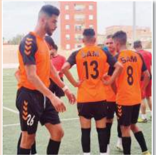
لدخول أجواء المنافسة الرسمية بقوة بعد حوالي عشرة أيام من انطلاق البطولة.