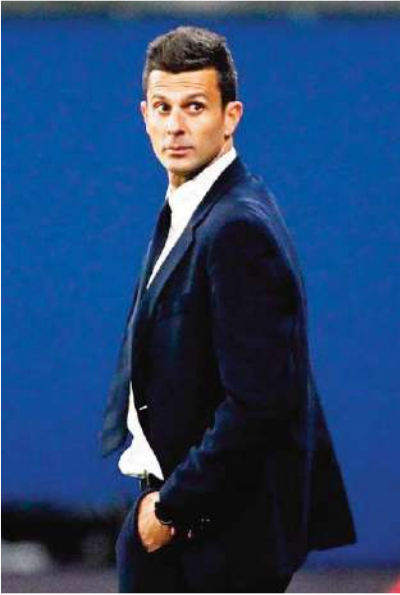
عتر تباغو موتا،

مدرّب يوفنتوس ، عن رضاه بنقطة التعادل من المباراة التي جمعت أمام فريق ميلان في الدوري الإيطالي ، مشيراً إلى أن الفريق قدم أداءً دفاعياً جيداً على الرغم من قلّة الفرص الهجومية. وقال موتا إنه سعيد برويّة الفريق ، وتصرف ككل ، وأشار إلى أن النقطة التي حصل عليها الفريق قد تمنحه شعوراً بالثبات.