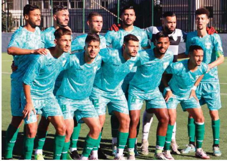
مؤعد عودتها سقترب أكثر وسيتمكنا من المشاركة في لقاءات البطولة بداية من الجولة 13 حين يستقبل الفريق واداد مستغمام في داربي قوي ومثير، عوضا عن الانتظار لغاية الجولة الـ 14 لو لم ترمح مباريات كأس الجمهورية هذا الأسبوع، لذا فان بلعابد و فريفر أكبر المستفيدين ومعهما المدرب لعمارة الذي سيحصل على خدمات اسمين مهمين من العداد.

سيعد فريق جمعية وهران اليوم لأجواء التدريبات والتحضيرات بعد أن استفاد اللاعبون من 48 ساعة للراحة والاسترجاع عقب الفوز اثنى في الجولة الـ 11 من عمر القسم الثاني هواة عن مجموعة وسط غرب على حساب شباب المشرية والذي مكن الفريق من الارتقاء إلى المركز الرابع و الاقتراب أكثر من الوديوم و