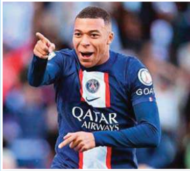
يبقى كيليان مباني نجم فريق باريس سان جيرمان ومنتخب فرنسا ماكينة أهداف لا تهدأ في ظل تجزئه بمعدل مميز للغاية. وفاز مباني الذي احتفل مؤخرًا بعيد

ميلاده الخامس والعشرين بجائزة الحذاء الذهبي لهداف الدوري الفرنسي في آخر 5 مواسم. ويعد كيليان فرسان الرهان الأول هذا الموسم وفي طريقه لانتزاع جائزة هدف الليج وان للموسم السادس على التوالي. ورغم الضغوط التي عاشها النجم الباريسي طوال العام الجاري على عدة أصعدة، لكنه لم يفقد حاسته التهديفية المميزة. تغيرت القيادة الفنية لبي إس جي بإقالة المدرب الفرنسي كريستوف غاليه والاستعانة بالإسباني لويس إنريكي. وقال إنريكي في مؤتمره الصحفي الأخير العام الجاري: «مهما كان المدرب، مباني بإمكانه تسجيل 50 هدفا في الموسم».