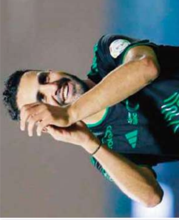
بانت أكرم بوراس مودف لوق مولود لجزائر بيلجكا، ما كلفت حه