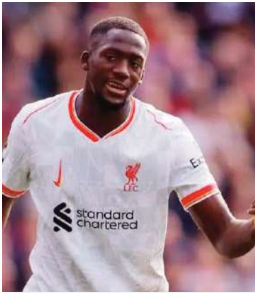
ليفربول، مما قد يتيح إمكانية ضمه بسعر أقل.

وفقاً للصحفي بول جويس، هناك بعض الشائعات التي تشير إلى أن ريال مدريد قد يكون مهتماً بالفعل بضم إبراهيم كوناتي، مدافع ليفربول. النادي الملكي يبحث عن تعزيز خط الدفاع للموسم المقبل، ويبدو أن اسم كوناتي بدأ يتردد ضمن الخيارات المحتملة. من جهة أخرى، يُبدي باريس سان جيرمان اهتماماً بالتعاقد مع المدافع الفرنسي هذا الصيف، مستغلاً عدم تجديد عقده بعد مع