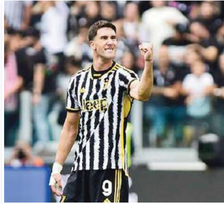
فلاهورفيتش (25 عاما) لصفوف يوفنتوس ومن المقرر أن ينتهي عقده في صيف عام 2026. في عام 2022، قادما من صفوف فيورنتينا.

أفاد تقرير صحفي إيطالي، يوم الثلاثاء، أن أحد نجوم يوفنتوس، ورفض عرضا من فريقه يوشكا توكي، من أجل الانتقال لصفوفه في الصيف المقبل. ويحسب صحيفة "توتو سبورت" الإيطالية، فإن المهاجم الصربي دوسان فلاهورفيتش، نجم يوفنتوس، لا يرغب في الانضمام إلى فريق يوشكا الذي يديره جوزيه مورينيو، خلال الانتقالات الصيفية المقبلة. وأضافت الصحيفة أن اللاعب ينتظر عرضا من أحد أندية الدوري الإنجليزي في نهاية الموسم الجاري، رغم أن الفريق التركي كان على استعداد يقدم له نفس راتبه السنوي المقدر بـ 12 مليون يورو سنويا. وأشارت إلى أن رفض فلاهورفيتش للانتقال إلى الدوري التركي، لا يعني أنه سيستمر في يوفنتوس. وتلفت بأن المهاجم الصربي لم يتوصل لاتفاق مع بيانكونيري بشأن تجديد عقده. وانتقل