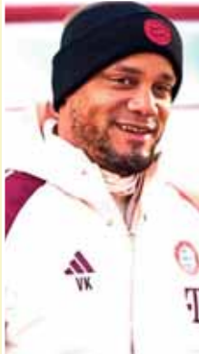
قدينال مدرب نادي بايرن ميونخ الألماني، فينستت كومباني، مكافأة مالية كبيرة تصل إلى مليون يورو في حال فوز الفريق بدوري أبطال أوروبا هذا الموسم. وبحسب تقارير إعلامية، يتضمن عقد المدرب بدأً منحة هذه المكافأة في حال التويج باللقب الأوروبي، في خطوة تعكس أهمية البطولة

بالنسبة للنادي البافاري. ورغم الحديث عن الخواطر المالية، يركز كومباني حالياً على المهمة الرياضية الصعبة، حيث يستعد الفريق لمواجهة قوية في نصف النهائي أمام باريس سان جيرمان، مع إمكانية مواجهة أحد كبار أوروبا في المباراة النهائية. ويأمل بايرن ميونخ في مواصلة مشواره نحو اللقب القاري وإضافة بطولة جديدة إلى خزائنه هذا الموسم.