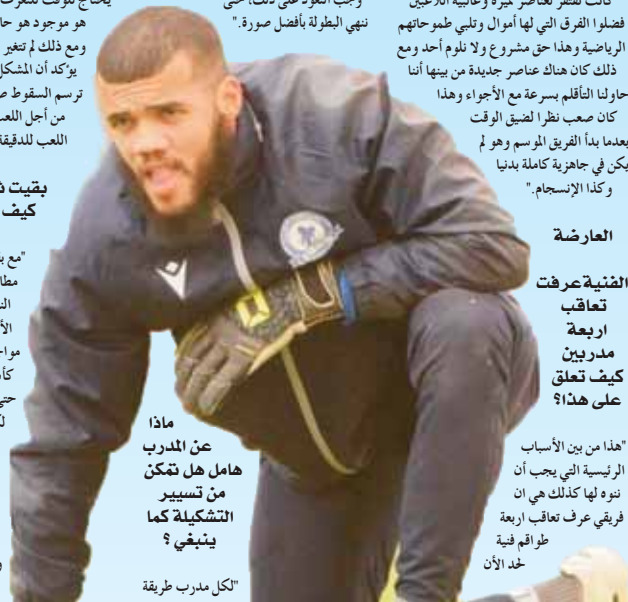
ماذا عن المدرب هامل هل تمكن من تسيير التشكيلة كما يتبغني؟ "كل مدرب طريقة

"وهو كذلك لأن المولودية لم تحقق في الشطر الأول من البطولة سوى ستة نقاط وهي حصيلة جد ضعيفة وسلبية على طول الخط ولم تكن متوقعة كذلك رغم الظروف التي سبقت إنطلاق الموسم، أظن أن أي فريق يجب عليه أن يظهر نيته من البداية وفريقي كان خارج الإطار كما سبق وذكرت وهناك العديد من المعطيات والأسباب الكثيرة".