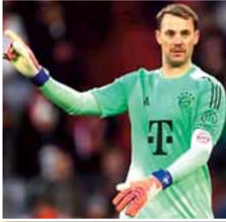
أعرب بايرن ميونخ تفارلاً كبيراً بشأن استمرار حارسه الأسطوري مانويل نويز لموسم إضافي في الدفاع عن

مرمى الفريق. وأفادت التقارير أن إدارة الفريق البافاري قد جهزت بالفعل عقداً جديداً للحارس الألماني يمتد حتى جوان 2027، وهي الآن بانتظار موافقة نويز النهائية لمنحه الضوء الأخضر. تأتي هذه الخطوة تقديراً لمكانة نويز ودوره القيادي على مر السنوات مع البايرن، حيث يفضل النادي الصبر ومنح الحارس الخضر الوقت الكافي لاتخاذ قراره، تأكيداً على الثقة المتبادلة بين الطرفين في استكمال المسيرة داخل أليانز أرينا.