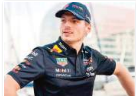
ريد بول آر بي 19، أحرز ابن الـ 26 عاماً المركز الأول في 19 من السباقات الـ 22، مُحسِّناً رقمه القياسي السابق الذي حققه في 2022 "15 فوزاً"، متفوقاً على الأسطورة

ميكائيل شوماخر من حيث نسبة الانتصارات في موسم واحد (36.86٪) للهندي مقابل 22.72٪ للألماني عام 2004. وإن تحققت 10 انتصارات متتالية خلال الموسم في إنجاز قياسي آخر، فهذا كافٍ بطبيعة الحال كي تسحق المنافسة، وتجعل الآخرين يتقاتلون من أجل الوصافة. وبإنجائه الموسم بـ 57.57 نقطة، بات فيرستابن أيضاً أول سائق يصل إلى 500 نقطة أو أكثر، متفوقاً على وصيفه زميله المكسيكي سيرجيو بيريس، الفائز بسباقين في 2023، بفارق أكثر من الضعف (285 نقطة للأخير). وعلى صورة فيرستابن، احتكر فريق ريد بول السباقات خلال الموسم ولم تقلت منه سوى جائزة سنغافورة الكبرى التي فاز بها سائق فيراري الإسباني كارلوس ساينس.