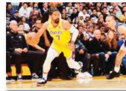
الجديد بسبب الإصابة. ويستعد فريق مدينة نيويورك لمواجهة غريمه التقليدي (NBA).

كشفت تقارير صحفية يوم الإثنين أن جاي فينست، نجم لوس أنجلوس ليكرز، سيغيب عن الفريق نحو شهر ونصف بسبب إصابة في الركبة اليسرى، سيضطر معها للخصوض جراحة. وفي تصريحات لموقع ذي أثلينك، أوضح الصحفي الموثوق شمس تشارانيا، أن فينست سيخضع لجراحة في ركبته اليسرى، الثلاثاء. ولقت إلى أن فينست مضى في عملية تأهيل لمدة شهرين ليفتادى اللجوء خيار الجراحة، "وهو ما لم يكن ممكناً في نهاية الأمر". وبعد موسم كبير مع فريقه السابق ميامي هيت، حيث وصل معه للنهايات قبل أن يخرجوا على يد دينفر ناجنس، انضم صاحب الـ 27 عاماً لصفوف الليكرز الصيف الماضي. إلا أن لاعب الهجوم الخلفي لم يكن محظوظاً مع فريقه