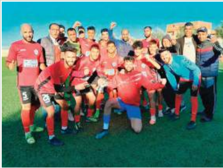
التسجيل حتى الآن.