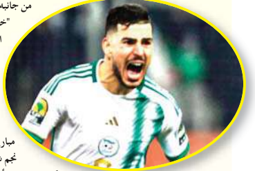
ويجب كرة القدم سواء براق أو وهران فإنه سيدعمنا، هذا أكيد".