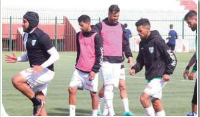
التحضير ليومين إضافيين.

وبما أن موعد برمجة مواجهة لازمو و راند القبة قد تم تغييره، فإن الطاقم الفني و الإداري قد شرعوا في البحث عن مباراة ودية تحضيرية، إذ كانت الاتصالات تجري على قدم و ساق طيلة نهار أمس من أجل إيجاد منافس رغم صعوبة المهمة، إلا أن