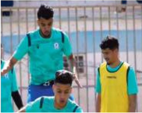
مع مولودية البيض.