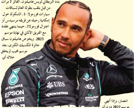
انتصار، وإذا انتهى موسم 2022 دون أن

بدد البريطاني لويس هاميلتون، الفائز 7 مرات من قبل بلقب بطولة العالم لسباقات سيارات فورمولا-1، الشكوك حول إمكانية رحيله عن فريقه مرسيدس أو اعتزال فورمولا 1، حينما ينتهي عقده مع الفريق الألماني في نهاية موسم 2023. ويخوض هاميلتون سباق جائزة المكسيك الكبرى، بعد موسم محبب لم يحقق خلاله أي