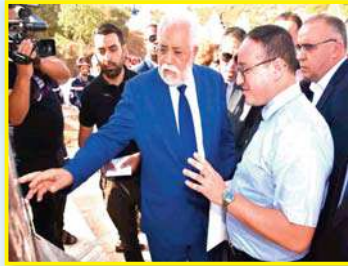
تحدثت سابقا بالتفصيل عن المشاكل التي يتخطى فيها نادي مولودية سيق لكرة اليد.

أكثر عن الفكرة وتجسيدها على أرض الواقع. بهذا، نتجه الوضعية المزرية للنادي نحو الإنفراج، بعدما كانت جريدة بولا الرياضية قد