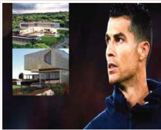
في ظل الأزمة التي يعانيها كريستيانو رونالدو مع إريك تن هاغ مدربه في مانشستر يونايتد، اشترى أعلى قصر في البرتغال، مما يؤكد الشائعات بأنه قد يختم

مسيرته الكروية في وطنه تحقيقاً لأمنية والدته. وتشير التقارير إلى رحيل رونالدو عن يونايتد في الانتقالات الشتوية المقبلة بشهر يناير 2023 بعد أن أصبح أسير مقاعد البدلاء ولا دور له يذكر هذا الموسم، في حين كان هداف الفريق بالفوس الماضي. وكانت اللفة رونالدو قد صرحت في الموسم الماضي بأنها تريد أن يعود إليها فريق طفولته سبورتنغ لشبونة البرتغالي الذي ارتدى قميصه عام 2002 قبل أن ينتقل في العام التالي لمانشستر يونايتد في فترته الأولى. وذكرت صحيفة "ماركا" (MARCA) الإسبانية أن رونالدو وشريكه جورجينا روبريغز اشترى قسراً في منطقة كاسكايس الراقية بالبرتغال، بقيمة نحو 11 مليون دولار، ولكن مع أعمال تجديده وجميع الإنشاءات التي سيدخلونها عليه سيصل سعره إلى 21 مليون دولار. وقالت الصحيفة إن قصر رونالدو هو الأعلى في البرتغال ويقع في قلب واحدة من أرقى المناطق السكنية في البلاد فيما يسمى بالريفيرا البرتغالية، والتي تضم مدن كاسكايس وإستوريل وسينترا الجميلة. وأشارت الوكالة العقارية التي تولت مسؤولية تطوير قصر رونالدو الجديد الذي سيسلمه بداية العام المقبل، إلى أنه مصمم على أحدث الطرز العالمية ويقع على مساحة 2720 متراً مربعاً وتبلغ مساحة البناء 544 متراً مربعاً ويتكون من 3 طوابق ويضم حدائق ومسبحاً وانفاً.