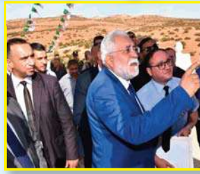
كان للوالي لقاء مع المجتمع المدني في قاعة الندوات بمقر بلدية زهانة، أين استمع لكامل الانتشالات، مطالبات مدراء المديريات ورئيس الدائرة والجلس الشعبي البلدي بالحلول الفورية. كانت أبرز مطالب المجتمع المدني من الناحية الرياضة بانجاز ملاعب جوارية في كل من

جنين مسكين، زهانة، القعدة، زغلول، وتغطية الملعب البلدي في قرية زغلول بالعشبة الاصطناعي، الخديوية جنب ملعب "كلواز أحمد" بزهانة، زائد مسيح شبه أولمي في المركب الرياضي بزهانة أيضا. بالإضافة إلى مطالب أخرى كربط المنازل بشبكة الغاز وتهئية الطريق في قرية زغلول، مستشفى بسعة 60 سرير بزهانة، توفير مركز للشرطة في قرية جنين مسكين، وتهئية المدارس والمتوسطات المنهارة التي تعاني من الانكساظ في كامل تراب الدائرة. توفير الإنارة وربط المسالك الريفية بشبكة المياه والكهرباء، كلها