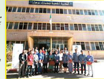
بسبب التطور التكنولوجي الحاصل في وسائل

النقل، الاتصال، تحرير المبادلات التجارية وتكريس مبدأ المنافسة الحرة بين الدول. كما يقوم ذات القطاع باللجوء الأمني من خلال مكافحة الغش والتهرب والافات الكبرى العابرة للحدود. المدير الجهوي للجمارك بوهران بالنيابة، المراقب العام السيد بن عمار أحمد أكد كذلك بأن العمل الجوارى والتنسيق في إمداد الصحافة بالمعلومة في حينها ساهم بشكل فعال في التقليل من خطورة الأوضاع. منهاها بالدور الكبير للصحفي من خلال عمله اليومي من خلال مراقبة السلطات العمومية والأمنية من أجل تجسيد التنمية المحلية في الميدان وتكريس الأمن بالتعاون الكبير والتنسيق الدائم في تحقيق الأهداف الكبيرة التي تسعى