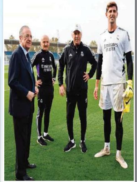
استعاد فلورنتينو بيريز رئيس نادي ريال مدريد الإسباني عافيه من جديد بعد إجراءه عملية جراحية، وقام بزيارة تدريبات الفريق الملكي صباح الجمعة، والذي يستعد لمواجهة جيرونا الأحد. وخضع فلورنتينو بيريز رئيس نادي ريال مدريد، لعملية جراحية في إحدى الرئتين مؤخراً، غاب بسببها عن مباراة

الفريق الملكي الماضي ضد لايسيزج الألماني في دوري أبطال أوروبا. وأوضحت صحيفة "ماركا" الإسبانية أنه بعد خضوع رئيس نادي ريال مدريد لعملية جراحية الرئتين، تعافى بشكل تام وقام بزيارة الفريق الأول اليوم الجمعة في التدريبات. كانت الصحيفة نفسها قد أشارت إلى إن حالة فلورنتينو