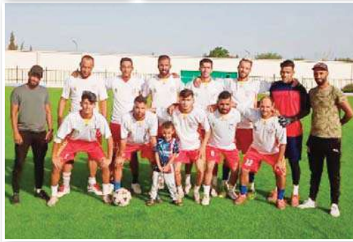
القائمة النهائية لفريق أتليتيك عقاز