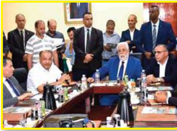
الوالي وتم تدوينها على معاينتها قريبا. كما أكد السيد