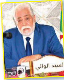
السيد الوالي قطار الفلاحة بأنه سيتم تجسيد عملية واسعة لتطهير الأراضي الفلاحة الموجهة للاستثمار وغير المستغلة من طرف أصحابها.

جنين مسكين، زهانة، القعدة، زغلول، وتغطية الملعب البلدي في قرية زغلول بالعشبة الاصطناعي، الخديوية جنب ملعب "كلواز أحمد" بزهانة، زائد مسيح شبه أولمي في المركب الرياضي بزهانة أيضا. بالإضافة إلى مطالب أخرى كربط المنازل بشبكة الغاز وتهئية الطريق في قرية زغلول، مستشفى بسعة 60 سرير بزهانة، توفير مركز للشرطة في قرية جنين مسكين، وتهئية المدارس والمتوسطات المنهارة التي تعاني من الانكساظ في كامل تراب الدائرة. توفير الإنارة وربط المسالك الريفية بشبكة المياه والكهرباء، كلها