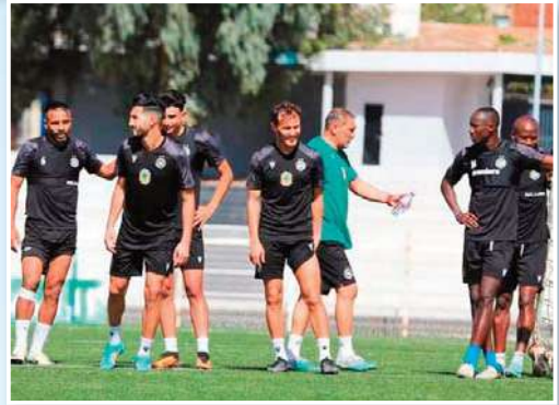
وأخرى إنسجبت كليا من الساحة الكروية

كدفاع تاجنانت دون نسيان معاناة البعض في الأقسام الجهوية كأهلي برج بوعريريج ومولودية العلمة، عموما فإن الإحتراف في بلادنا حاليا بدأت بعض ملامحه لكن يتدخل الدولة وذلك ببناء ملاعب عصرية ومنشآت قاعدية من شأنها أن تساهم بشكل كبير في تطوير الكرة خاصة بعد تسليم هاته الملاعب التي أصبحت تحت تصرف الأندية في انتظار باقي الملاعب المرجحة خاصة في الجنوب الذي كان يعاني التهميش ولم يستفد من هاته المشاريع. الأكيد من كل هذا أنه بالرغم من إستفادة بعد الفرق من شركات وطنية لتدعمها ماديا وهي التي عينت رؤساء مجالس إدارة حتى تقوم بتسيير الجانب الإداري لكن وحسب ما تم دراسته على أرض الواقع فإن نفس السيرة لا تزال تسيير عليها حيث تقوم كل صانعة بتغيير الععداد بنسبة 90 بالمائة مع جلب لاعبين بالمالير