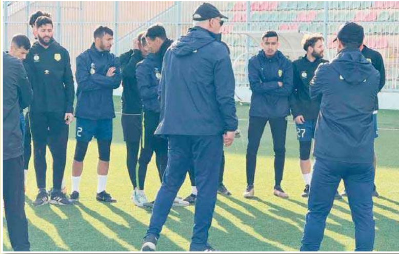
الماضي في فندق «فاردي ليلي» بسن عكنون.