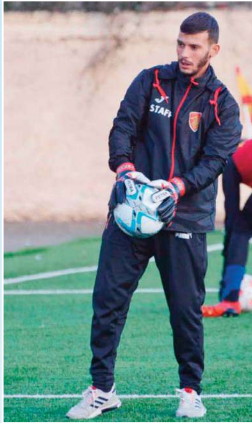
إضافية ومتابعة دورات تدريبية متخصصة. ما هي طموحاتك لهذا الموسم مع الفئات الشبانية للنادي؟

بالطبع، البدايات دائماً تكون صعبة. واجهت تحديات مثل نقص الإمكانيات والشك في