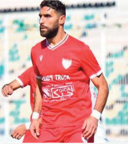
الأموال منذ بداية الموسم الحالي..

تحدثت عن شهر رمضان منصور ما هو برنامجك خلال هذا الشهر؟