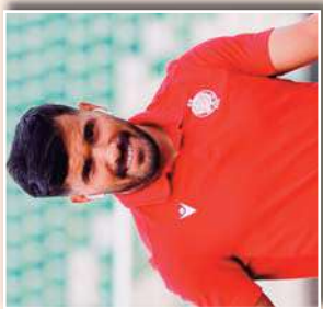
بن دوري أبطال إفريقيا... بن دوري أبطال إفريقيا...