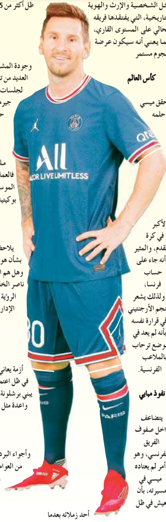
أحد زملائه بعدما

مثل الشخصية والإرث والهوية التاريخية، التي يفقدها فريقه الحالي على المستوى القاري، مما يعني أنه سيكون عرضة لهجوم مستمر