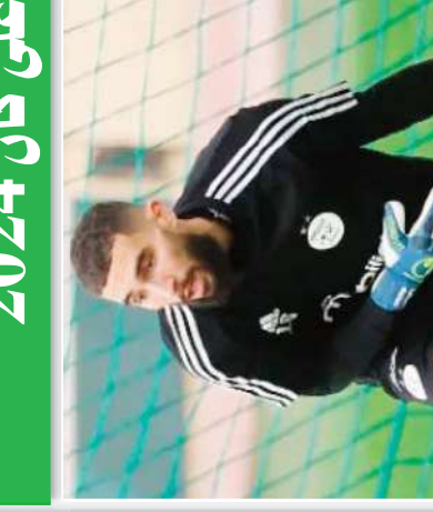
مندوريا؛ المنتخب يملك تشكيلة رائعة ويتنافس على كان 2024...