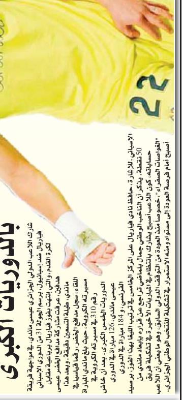
بالدوريات الكبرى 310 في مسيرته... بالدوريات الكبرى 310 في مسيرته...