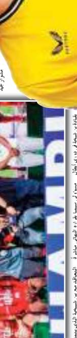
فوز بن شيخة بـ 3 أهداف على فريق الجيش في مباراة الدوري الأول بتاريخ 14 أفريل 2024.