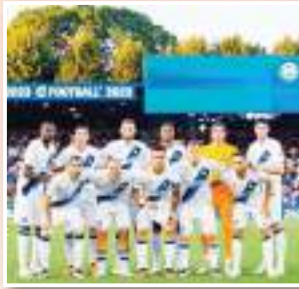
بعد ظهوره بصورة طيبة هذا الموسم.

لمح أو سيليو مدير إنتر ميلان الإيطالي إلى استبعاد فكرة التعاقد مع جوشوا زيركزي نجم بولونيا، وألبرت جوموندسون لاعب جنوي، مشيراً إلى أن الإنتر سيكون لديه 4 مهاجمين في الموسم المقبل وليس خمسة. وارتبط اسم جوشوا زيركزي بالرحيل عن بولونيا بعد تألقه مع الفريق الإيطالي وسط اهتمام قطبي ميلانو بضمه. ونفس الشيء بالنسبة لجوموندسون الذي ارتبط اسمه بالانتقال إلى إنتر ميلان بعد ظهوره بصورة طيبة هذا الموسم.