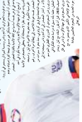
لاعب في فريقنا يـتأهب للمشاركة في الدوريات الأوروبية.

في إطار استعداداتنا للمشاركة في الدوريات الأوروبية، نركز على تطوير اللاعبين الشباب وتقديمهم على المستوى الدولي. هذا الاستثمار في المستقبل يهدف إلى تعزيز كفاءة الفريق وتحقيق أفضل النتائج على الساحة الأوروبية.