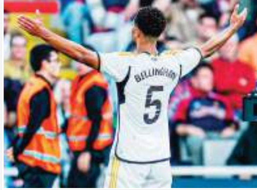
لأنه لا يزال أماننا مباريات متبقية في دوري أبطال أوروبا، لكن في هذه اللحظة، أعقد أن بيلينغهام وكيليان مبابي من أبرز لاعبي العالم بالنسبة لي".

صرح البولندي روبرت ليفاندوفسكي نجم وهداف برشلونة الإسباني أن الإنجليزي جود بيلينغهام لاعب ريال مدريد الإسباني وكيليان مبابي نجم باريس سان جيرمان الفرنسي والقريب من الانتقال للريال هما الأفضل في العالم بالوقت الحالي. وانتقل جود بيلينغهام للعب في صفوف ريال مدريد هذا الموسم قادماً من بوروسيا دورتموند الألماني، ولم يستغرق طويلاً حتى بات النجم الأول للمرينغي. بينما يستمر كيليان مبابي ابن 25 عاماً في تقديم مستويات رائعة مع فريقه باريس، والجميع الآن يترب إعلان انتقاله الرسمي للريال.