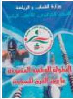
البطولة فرصة لتحضير للمنافسات القارية

أفريل إلى 5 ماي 2024، وبطولة المياه المفتوحة التي ستقام في بولندا يوم 5 ماي 2024. وقد حرص الاتحاد الجزائري للرياضات المائية على توفير جميع الظروف الملائمة لإنجاز هذه البطولة، من تجهيزات تقنية عالية المستوى وطاقم تحكيم ذو خبرة، لضمان سير المنافسات في جو من النزاهة والروح الرياضية.