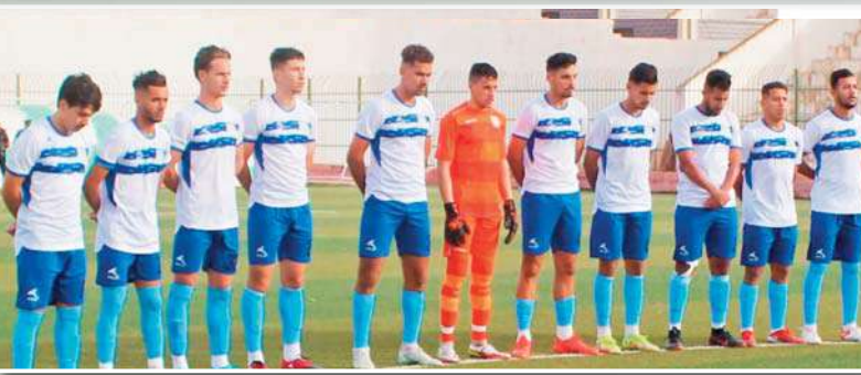
مليار دون احتساب الموسم الحالي.