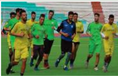
موعد مباراة إتحاد تلمسان هذا السبت.