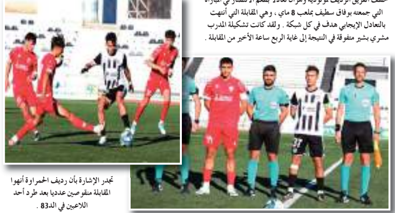
تجدد الإشارة بأن رديف الحمراوة أنهوا المقابلة متفوقين بعد طرد أحد اللاعبين في الداء 83 .