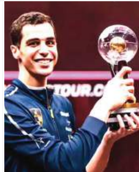
انتصر البطل المصري علي فرج -المنصف الأول عالمياً في الإسكواش- مراسمات تتويجه ببطولة «جي بي مورجان» بالولايات المتحدة، ووجه رسالة قوية إلى

إسرائيل لعدوانها على غزة وهو يرتدي قميصاً يحمل نقوشات الوشاح الفلسطيني وعبارة «إنها أمة». وتوج فرج (بطل العالم في اللعبة) بعد فوزه على اللاعب البيروفي ديفغو الياس، في نهائي البطولة المقامة في أميركا مساء الجمعة الماضي. وعقب فوزه بلبق البطولة العالمية، انتقد فرج -في كلمته أمام الجماهير- ما يحدث في قطاع غزة من قبل قوات الاحتلال، قائلاً «قبل الحديث عن المباراة وعن البطولة المذهلة التي خضناها أريد أن أتحدث عن موضوع واحد فقط هو الأهم في الشرق الأوسط: ما يحدث منذ السابع من أكتوبر، 30 ألف إنسان قتلوا، من بينهم رجال وأطفال ونساء، 85٪ من السكان البالغ عددهم 2 مليون تعرضوا للترديد في غزة المنازل دمرت» وأضاف أن هذا يجب أن يتوقف. وأضاف فرج «أشعر بخيبة أمل تجاه الموقف الأميركي لأن كل ما تم فعله منذ السابع من أكتوبر تمت تغطيته. يجب أن يكون هناك عدالة. كل ما يحدث يجب أن يتوقف اليوم وليس غداً، لذلك من فضلكم هذا ليس أمراً متعلقاً بالعرب أو المسلمين ولكنه متعلق بالإنسانية ويجب أن يتوقف الآن».