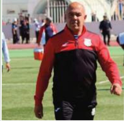
يحقق فيها الفوز إلا في مواجهتين فقط من للحرص بصفة عادية. أصل 11 لقاء.

و رغم أن التقني الغليزاني نورالدين بلجياتي يعرف البيت الغليزاني جيدا بحكم أنه كان يعمل بداية الموسم الحالي مديرا فنيا للفئات الشبانية ، إلا أنه سيكون أمام تحدي كبير من أجل إعادة قطار الراييد إلى السكة الصحيحة ، في ظل الوضعية الصعبة التي يعيشها مع بداية الموسم الجديد ، كما أنه سيترك فريقا يعاني من عدة مشاكل أبرزها غياب النشأت الإيجابية طيلة الجولات السابقة التي لم