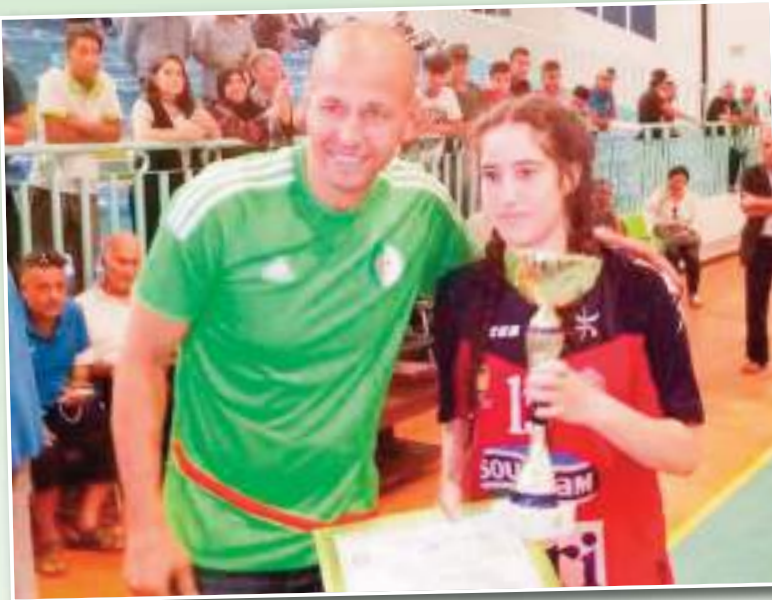
الجزائرية لكرة اليد و الطاقم الفني

الخضري في مجموعة ألمانيا ، النمسا و كرواتيا في الملحق الأولي...»