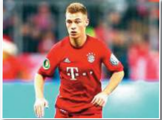
صرح ماكس إيرل المدير الرياضي لنادي بايرن ميونخ الألماني أن مستقبل جوشوا كيميشتش مع الفريق متروك بنسبة 100٪ له، مشيراً إلى أن كيميشتش لا يريد تجديد عقده إلا عندما يعلم هوية

وأكد إيرل في تصريحاته لشبكة «سكاي سورتس» بنسختها الألمانية على أن جوشوا كيميشتش يريد أن يعرف من هو المدرب الجديد وبعدها سيتخذ قراره. وتحدث إيرل قائلاً: «لقد أخبرنا كيميشتش بوضوح شديد أنه يريد أن يعرف من هو المدرب الجديد». وأضاف: «ستري ما إذا كان يريد البقاء. بغض النظر عن ما نريده نحن، فالأمر بكل تأكيد متروك لجوشوا في النهاية ليقرر».