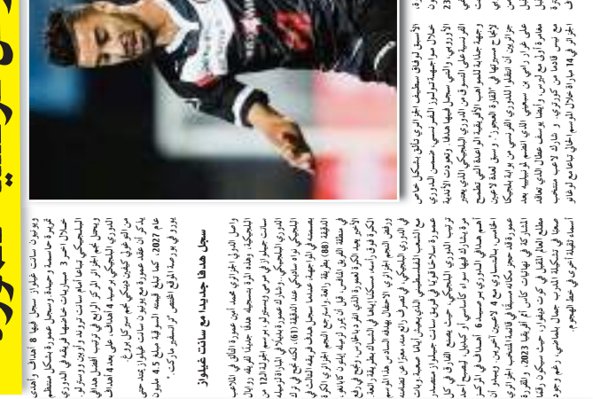
يشارك اللاعب عمورة في الدوري الفرنسي. وهو من اللاعبين الذين شاركوا في بطولة كأس العالم لكرة القدم 2014 في البرازيل.