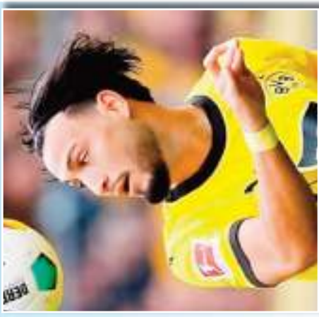
أصبح النجم الدولي الجزائري أمين سبعيني، لاعب نادي بوروسيا دورتموند، من أكثر اللاعبين الجزائريين مشاركة في هذه البطولة منذ إنشائها في سنة 2013. شارك سبعيني في 103 مباراة مع نادي بوروسيا دورتموند، وسجل 19 هدفاً في 103 مباراة. وهو من اللاعبين الذين شاركوا في بطولة كأس العالم لكرة القدم 2014 في البرازيل.