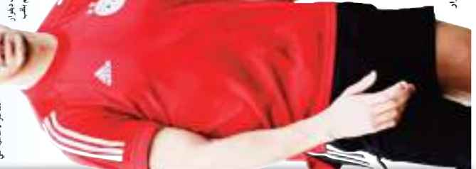
يشارك المنتخب الجزائري يوسف عطال في بطولة كأس العالم لكرة القدم 2014 في البرازيل. وعطال لاعب نادي بوروسيا دورتموند، وهو من اللاعبين الذين شاركوا في بطولة كأس العالم لكرة القدم 2014 في البرازيل.