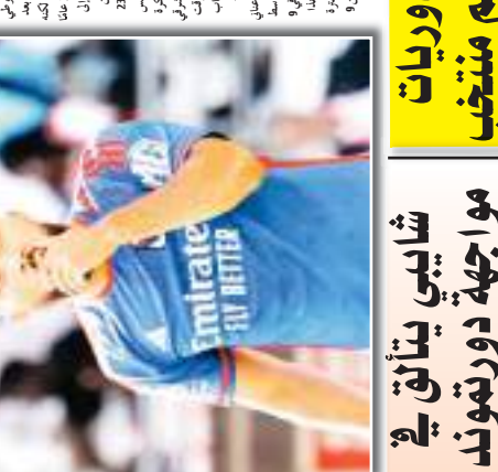
يشارك اللاعب غروسو في الدوري الإيطالي. وهو من اللاعبين الذين شاركوا في بطولة كأس العالم لكرة القدم 2014 في البرازيل.