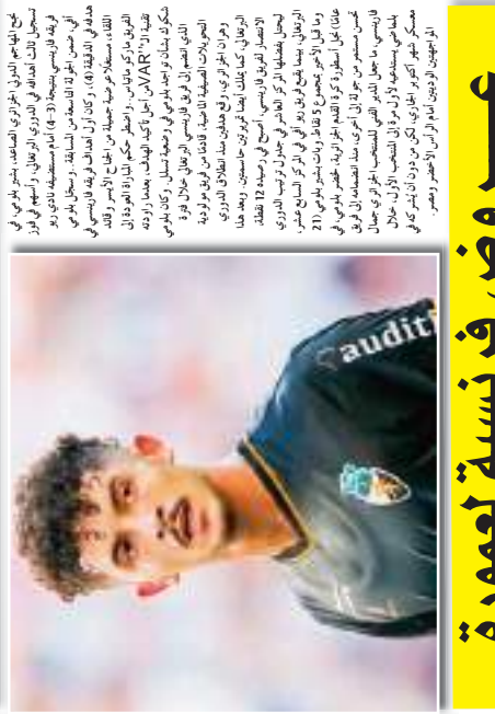
يشارك اللاعب بلومي في الدوري البرتغالي. وهو من اللاعبين الذين شاركوا في بطولة كأس العالم لكرة القدم 2014 في البرازيل.