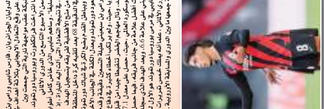
يشارك اللاعب شايبي في الدوري الألماني. وهو من اللاعبين الذين شاركوا في بطولة كأس العالم لكرة القدم 2014 في البرازيل.