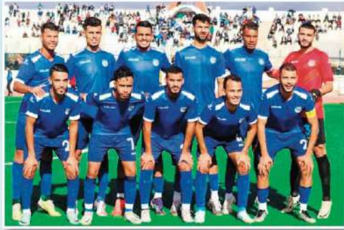
ويستقلون إلى تيارت بعرض تعويض الهزيمة الذي فرضه عليهم شبيبة تيارت بوسم الجولة الثامنة من البطولة الوطنية مرحلة الذهاب.

بخصوص التشكيلة التي سيقوم المدرب مرسل بوعلام بإقحامها في هذه المباراة أمام شباب عين تموشنت، فإنه من المنتظر أن تكون بعض التغييرات مقارنة بالمباراة السابقة أمام غالي عسكري، حيث من المنتظر أن يعود بعض اللاعبين إلى التشكيلة الأساسية، وبالتالي من الممكن أن يعيد هذا اللاعبين الأمان للدفاع الذي سيعمل على الإبقاء على نظافة الشباك