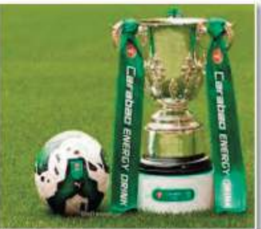
أسفرت قرعة دور الـ 8 من بطولة كأس الرابطة الإنجليزية الموسم الجاري 2023-2024، عن عدد من المواجهات النارية يهدها موقعة ليدز يونايتد وست هام