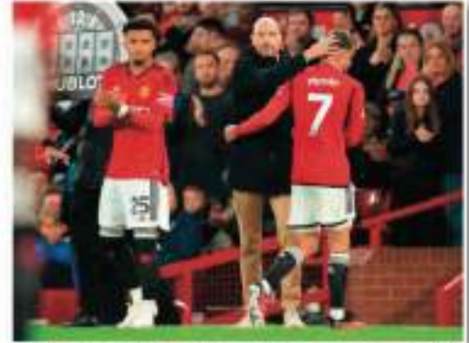
المدافع صحتي أن بوروسيا دورتموند سنة لإعارة لاعبه جيمي صفر جيتير، من جائون سانشو، ويربط اسم سانشو بالترخيص

من ناديه مانشستر يونايتد، خلال فترة الانتقالات الشتوية المقبلة، بعد خلافه الطويل مع مدربه الهولندي إريك تين هاج، وبحسب صحيفة «داس إن» فإن عودة سانشو لليفربول دورتموند في الوقت ذاته، من الخيارات المحتملة أمام النادي، أو أخيراً «الآن يونايتد» ملحق على بيع سانشو بشكل نهائي، لكن خيار الإعارة على الطاولة أيضاً، وتوحيلاً أن رالف سانشو، والذي يصل إلى 250 ألف جنيه إسترليني أسبوعاً، قد تلقى عطفة أمام دورتموند ويتعين على المخرج الإنجليزي، التوافق على بعض شروطه، من أجل تسهيل عودته إلى ناديه السابق الألماني، وتوضيح الصحيفة «لا شك أن إعارة جيمي صفر جيتير، لعودة سانشو إلى قلعة أسود الفسفوف، ويحتاج جيتير (33 عاماً) عرض عدد دقائق أكبر، بعدما شارك لمدة 117 دقيقة فقط في الدوري الألماني هذا الموسم».