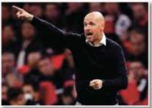
يوجد أي طريق آخر سوى الاتحاد، يجب على جميع اللاعبين التحلي بالانضباط وأن يمكن التعويل عليهم، وبالطرق إلى مواجهة فولهام اليوم بالدوري، يجب: «استيعاب الفريق واستيعاب الحقبة، وأهم شيء مستحضر من أجله هو عقلية الفريق».

أعرب إريك تين هاج، مدرب مانشستر يونايتد، عن أسفه بعد سقوط فريقه بطلاة نظيفة أمام نوكاسل على ملعب أولد ترافورد، مساء أمس الأربعاء، في ثمن نهائي كأس الرابطة، وقال تين هاج في تصريحات لبيكبي سبورتنج: «أعترف أن ما فعلناه ليس جيداً بما يكفي، علينا تحمل مسؤولية ذلك وهكذا أبدأ لشعر بالأسف من أجل المدعوم، وأصاف «علينا التعالي من ذلك سرياً، أمامنا مباراة مثقلة اليوم السبت، علينا رفع الغبار لدينا، ما فعلناه ليس جيداً بما يكفي»، وتابع: «أنا على ثقة بأن اللاعبين سيهضون وسيهضون، ما فعلناه ليس جيداً بما يكفي وأنا مسؤول عن ذلك، علينا النهوض معاً»، وأضاف: «علينا بالغة عندما نرغب في اللعب، علينا الحصول على النتائج الصحيحة والتواجد في التارية والفوز باللعابة، علينا القيام بكل ذلك معاً ولا يوجد أي طريق آخر سوى الاتحاد، يجب على جميع اللاعبين التحلي بالانضباط وأن يمكن التعويل عليهم، وبالطرق إلى مواجهة فولهام اليوم بالدوري، يجب: «استيعاب الفريق واستيعاب الحقبة، وأهم شيء مستحضر من أجله هو عقلية الفريق».