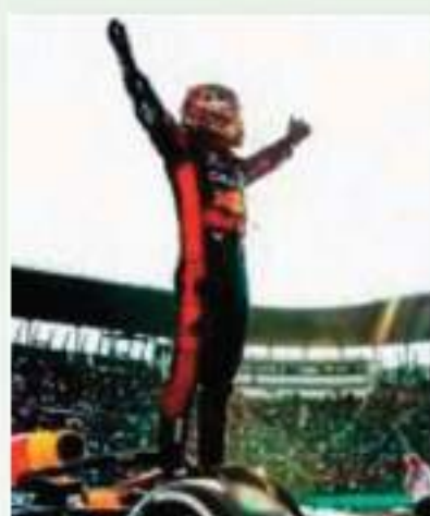
رفع سائق ريد بول الهولندي ماكس فيرستابن، يعلو العالم للفورمولا 1، رافداً، القياسي بعدد الانتصارات في موسم واحد إلى 19 عقب فوزه بالمكسيك الكبرى، الجولة العاشرة من البطولة العالمية.

وحادل فيرستابن (26 عاماً) في جائزة الولايات المتحدة الكبرى في 22 الشهر الحالي وفيه القياسي السابق الذي حققه العام الماضي حين تقدم على الألمان الأسطورة ميكائيل شوماخر وميخائيل فيل (35 لكل منهما)، قبل أن يحطه الأحمق على حلبة الشيفيلين رودريغيس، وأنهى فيرستابن، المتعلق من المركز الثالث، السباق (71 لفلاً) بوقت قدره 1:02:30.814، متقدماً بفارق 13.875 ثانية على سائق مرسيدس البريطاني لويس هاميلتون، يعلو العالم سبع مرات، والمتوج في المكسيك مرتين سابقة، 2014 و2023، على سائق فيراري شارل لوكلير من موناكو الذي حصد فضيلة انطلاق من المركز الأول عند المنطلق الأول لصالح الهولندي جراء حادث جمعة مع زميل الأخير المكسيكي سيرجيو بيريس الذي لم يهله الخط على أرضه وأمام جماهيره حيث اضطر للإستعاضة.