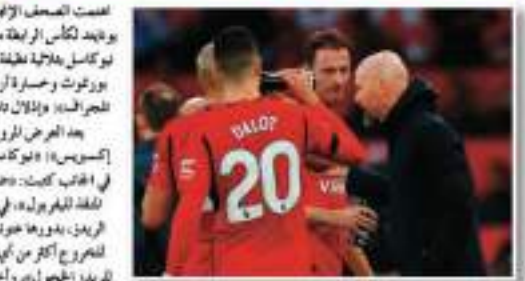
من أجل مستقبله بعد تعلم ليدز ليلقى الحارس الكاسح من طرف الصحافة الإنجليزية على مدرب الفريق ليدز، بهذا أن مستقبل ليدز في هاج أصبح مهدداً أكثر من أي وقت مضى.

اهتمت الصحف الإنجليزية الصادرة صباح الخميس، بتوضيح مانشستر يونايتد لكأس الرابطة من ثمن النهائي بعد السقوط على أرسنال في كأس أمم بورتووت وخساراً أرسنال أمام وست هام، وعبرت صحيفة «ديلي تلجراف»: «إذلال تام ليدز هاج - مدرب يونايتد - واجه أسئلة جاداً بعد العرض المروع في الكأس»، كما عرفت صحيفة «ديلي إكسبرس»: «ليوكاسل يزيد الضغط على ريمز بين هاج القرحوي»، في المقابل كتبت: «خبرة الفارق للمدعمين»، وكتبت أيضاً: «تولي ليلقة ليدز بول»، في إشارة إلى تسجيل داروين لوزي هدفه لتتصدر الفريق، بدورها عرفت صحيفة «ميرور»: «ليوكاسل يرفع بين هاج للمخرج أكثر من أي وقت مضى مع إذلال ليدز ونوليس وولوتو لريدز المحصول»، وأخيراً كتبت صحيفة «تيلي ميل»: «بين هاج يتأقلم من أجل مستقبله بعد تعلم ليدز ليلقى الحارس الكاسح من طرف الصحافة الإنجليزية على مدرب الفريق ليدز»، بهذا أن مستقبل ليدز في هاج أصبح مهدداً أكثر من أي وقت مضى.