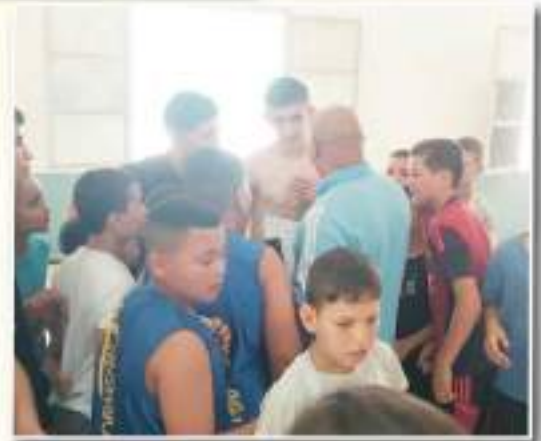
المعروفين على الساحة الوطنية يستقبلونها

بمغربي يتظم مأدبة غذاء على شرف نادي كونغ فو ساندا في يهد. حيث حظي التوفيق باستقبال حار وكانوا سعداء بهذه المبادرة.