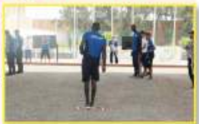
الترتبة الأولى، فيما فازت الجزائر على فلسطين في انتظار باقي المنافسات.

تواصل فعاليات منافسات الكرة الحديدية بمركب لالوفا بمدينة وهران، لحساب المسابقة الخامسة عشرة من الألعاب العربية، حيث شهدت الأيام الأولى الجولات التصورية مع منافسة حرسة تونس وموريتانيا مع اللعبة الوطنية التي تنسى لها كيد النتائج المترفة التي تخلقت في ألعاب البحر الأبيض المتوسط الصيف لخاصي بمدينة وهران، حيث أكد المنظم الوطني محمد التويج في اليوم الأول في إحصائيات الرسي بالشفقة برصيد 33 نقطة بالنسبة للذكور، تلاها كل من المغرب، تونس وموريتانيا في المركز الأخير، أما في منافسة لاتي الصب المصغر، فاحتلت موريتانيا في