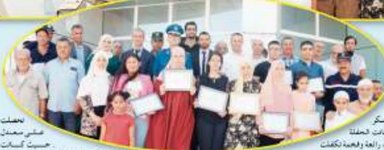
مستكر وكانت الحفلة جد رائعة وفجدة تكفلت بكل مضاريفها الجميلة

على هامش لحفل العديد من التلاميذ الجاه في دائرة زهانة على معدلات جيدة في شهادة التعليم المتوسط و شهادة البكالوريا، قامت جمعية تور الإسلام محمد الجزائرية بحي النصر زهانة بخطة خاصة على شرف تلاميذ الأربع متوسطات بزهانة، وإثابة أحمد زهانة في المكتبة المركزية و هالة حيث تم تكريم الناجحين بهذا القيمة وشهادات تقديرية تقديرا على الجهود والالتزام الجيدة التي شرفت دائرة زهانة وجعلتها من الأوائل في ولاية