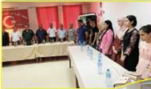
مسؤولين وشخصيات عديدة حضرت الحفلة