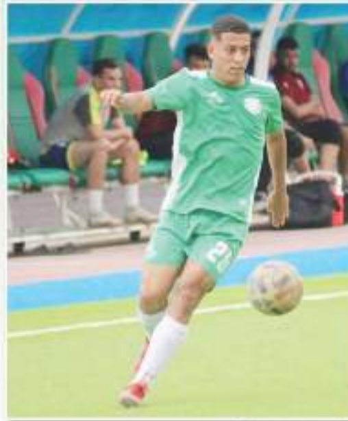
الشعبية تحل محل علاقة جيدة وضمان عودة الفريق لسابق عهده.

هل ترى بأن الفريق يعاني من التأخر قليلا في الخلاقة التدريبات؟