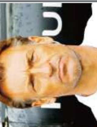
رونار وصانع أفلام كيروش الذين تم التعاقد معهما من قبل المنتخب الجزائري.

رونار وصانع أفلام كيروش الذين تم التعاقد معهما من قبل المنتخب الجزائري. هذا هو اللاعب الذي انضم إلى فريق الجزائر.