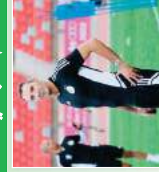
صادي يريد توأجا رومانو في الطاقم الجديد للخضر. هذا هو اللاعب الذي انضم إلى فريق الخضر.

صادي يريد توأجا رومانو في الطاقم الجديد للخضر. هذا هو اللاعب الذي انضم إلى فريق الخضر. اللاعب هو من مواليد 1998م وتعد من اللاعبين الواعدين للكرة الجزائرية.