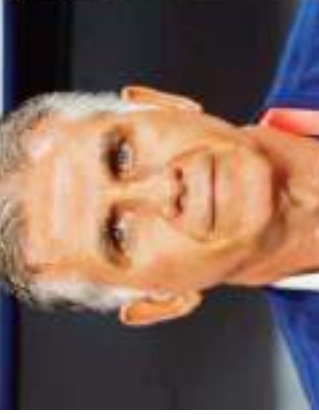
عوار يسمى لرد الاعتبار مع المدرب الجديد. هذا هو اللاعب الذي انضم إلى فريق الجزائر.